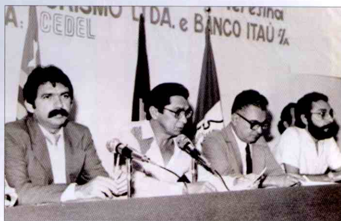
Lojistas de Teresina se destacam pela união em seu trabalho