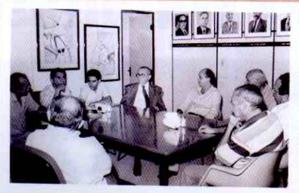
Diretores lojistas reunidos com o ex-governador Alberto Silva