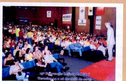
Convenções: auditórios sempre lotados