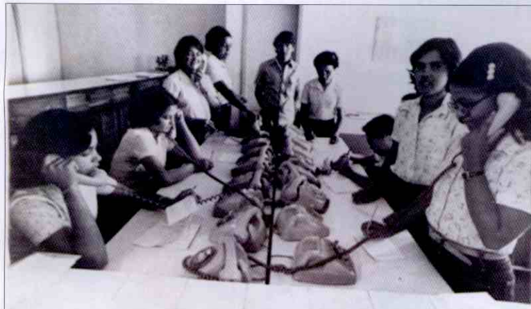
Antiga Central telefônica, que hoje está totalmente modernizada

todos esses anos", comenta o presidente. Sua atuação vem também investindo em tecnologia, estruturação da nova sede e no aperfeiçoamento dos serviços oferecidos pela CDL e SPC, além de manter fortes os laços entre as entidades de classes para consolidar ainda mais o setor comercial. "A maior vitória é dos lojistas que nesse ano poderão comemorar os 40 anos de CDL Teresina orgulhosos de uma trajetória de muitas lutas, vitórias e principalmente conquistas. Estamos todos de parabéns: equipe da CDL, diretores, lojistas e toda a sociedade piauiense", alegre-se.