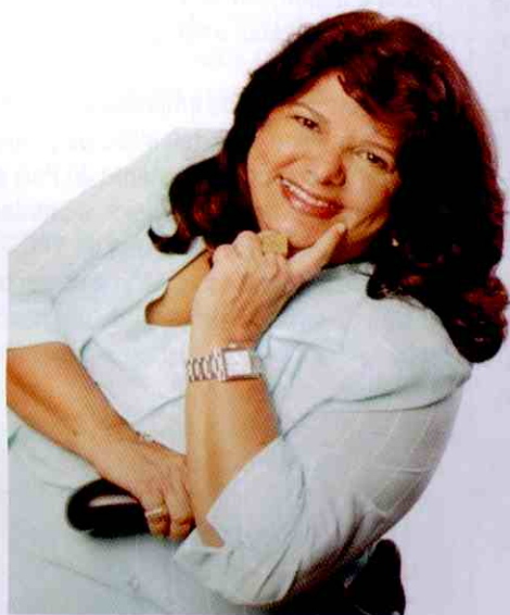
Luiza Helena, proprietária da rede de varejo do Magazine Luiza, é considerada uma das maiores palestrantes do Brasil

O encontro empresarial do Piauí reúne, a cada edição, um maior número de lojistas da capital e do interior, empresários da indústria e do setor de serviços, profissionais liberais, lideranças políticas e estudantes. A convenção, além de capacitar e qualificar os profissionais locais, ainda traz para o Estado o aquecimento do setor de comércio, serviços e turismo.