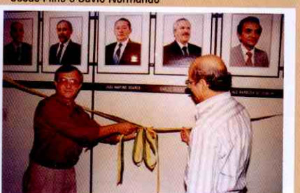
Inauguração da galeria dos ex-presidentes