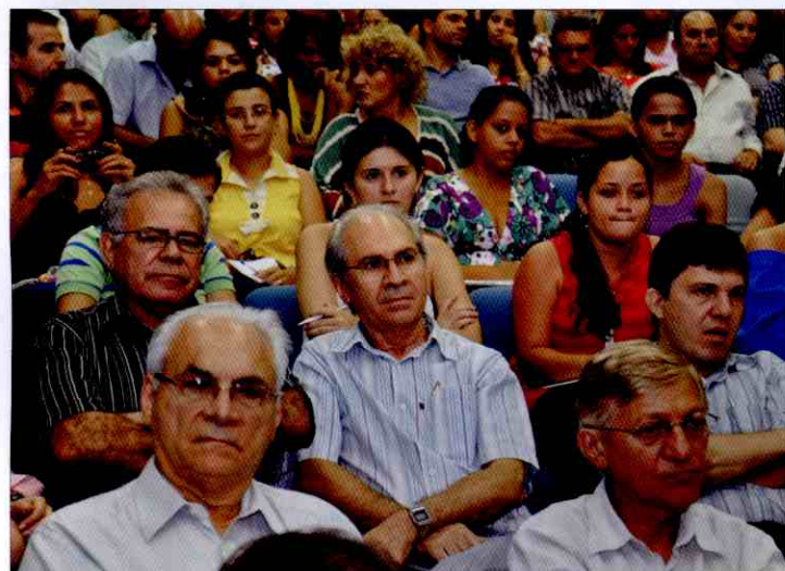
● Diretores lojistas prestigiam a palestra do ex-ministro