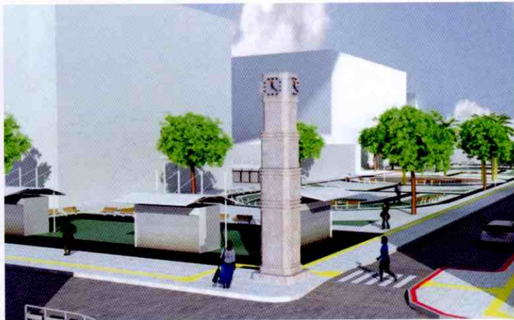
Ao finalizar as obras, o centro da capital promete ser um dos mais bonitos do país