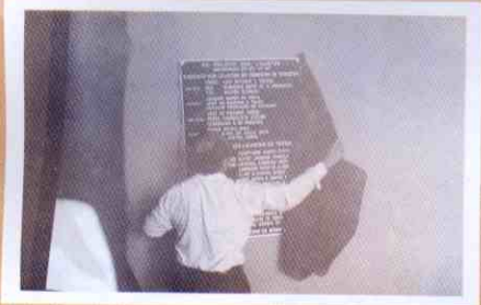
Inauguração do Ed. Palácio dos Lojistas