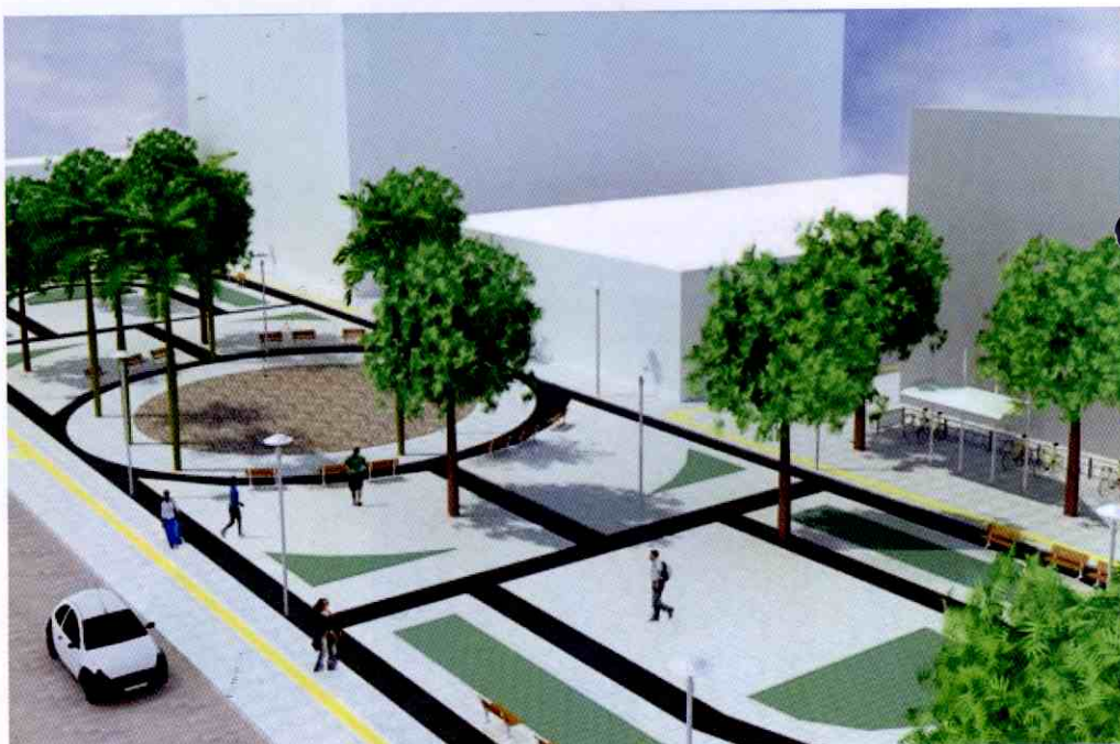
Teresinenses agora podem andar livremente pelo comércio local

Os lojistas contribuíram para essa transformação, que trouxe inúmeros benefícios para os teresinenses que circulam diariamente pela região central da cidade. As ruas ganharam um piso pré-moldado,