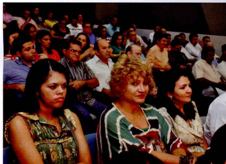
Evento reuniu convidados dos mais variados setores da economia